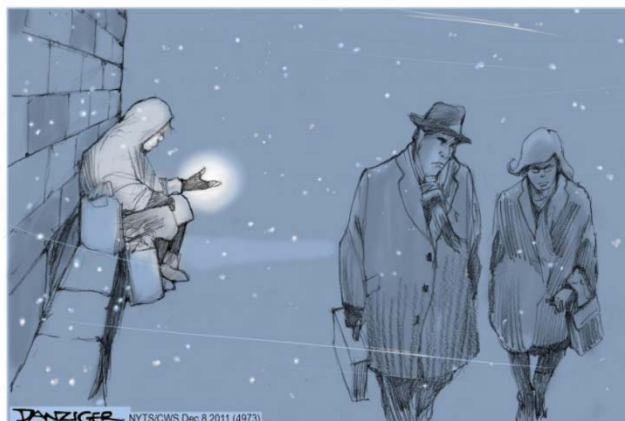
The "Invisible Hand"

Η έκθεση προσέφερε τις απόψεις 28 σκιτσογράφων, ενός ανά κράτος μέλος της ΕΕ, πάνω στις τρέχουσες προκλήσεις, τα κενά και τις προοπτικές όσον αφορά την προστασία των ανθρωπίνων δικαιωμάτων στον κόσμο. Καταγγέλλθηκαν παραβιάσεις των ανθρωπίνων δικαιωμάτων και εμπόδια. Επίσης, τέθηκαν ερωτήματα για τις επιπτώσεις της άρνησης των δικαιωμάτων σχετικά με την αστική, πολιτική, κοινωνική, οικονομική και πολιτιστική ανάπτυξη. [...]